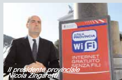
Il presidente provinciale Nicola Zingaretti

U n convegno organizzato lo scorso 18 marzo dall'amministrazione provinciale capitolina in collaborazione con l'Università degli studi di Roma "Foro Italico", l'Ircamb (Centro interuniversitario per lo sviluppo delle interazioni tra campi elettromagnetici e biosistemi) e il Capsur (Consorzio interuniversitario per le applicazioni di supercalcolo per università e ricerca), ha inteso fare il punto della situazione sullo stato d'avanzamento della rete d'accesso al Wi-Fi, ad un anno e mezzo dall'inizio del progetto fortemente voluto dal presidente Nicola Zingaretti. Si tratta del più imponente progetto in Italia per la diffusione del Wi-Fi per numero di abitanti coinvolti: 230 i punti di accesso a internet gratis senza fili finora installati, 137 hot-spot nella capitale e 93 nel territorio provinciale. Altri 500 punti sono previsti entro la fine dell'anno che raggiungeranno 4 milioni di persone ed oltre 120 comuni. "La rete provinciale sta crescendo sul territorio, favorendone la modernizzazione: presto raggiungeremo la quota dei 500 punti di accesso in tutta la Provincia — ha detto Zingaretti — e ci integreremo con attività commerciali e grandi partner. Qualcuno all'inizio ha storto il naso, perché il servizio pubblico gratuito sta sostituendo quello privato a pagamento, ma poi tutti ne hanno capito i vantaggi".