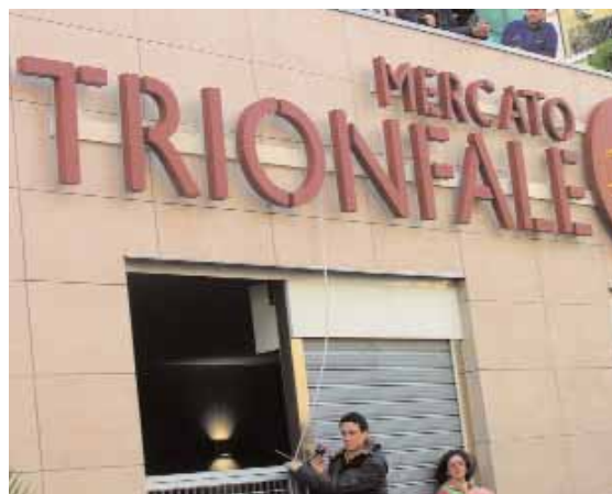
Mercato Trionfale: all'interno della struttura, inaugurata più di un anno fa dal sindaco Alemanno, dovrebbero sorgere un asilo nido e una biblioteca

Dati alla mano, il presidente fornisce alcuni esempi pratici: "Per ciò che riguarda gli interventi dedicati alla mobilità, e dunque alla manutenzione ordinaria di strade che necessitano di interventi continui, i fondi disponibili sono già stati tutti impegnati. Se pensiamo che questo municipio ospita ogni giorno sino a mezzo milione di persone (tra residenti e non), con ciò che ne consegue in termini di traffico (privato e pubblico) e usura del manto stradale, si può immaginare quale sia il danno subito e quali le diffi-