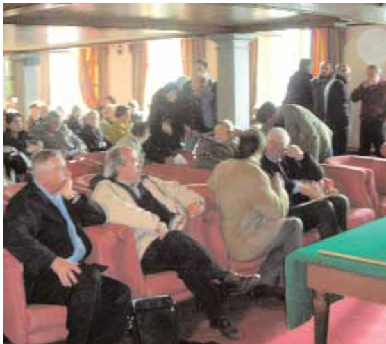
Una fase del dibattito presso il Casale Belvedere

La zona di Roma Nord ricade nell'area D3, "tutta quest'area - ha precisato l'architetto Salvatore Codispoti, direttore dell'Ente Parco di Vejo - permette tre tipi di trasformabilità. Con l'approvazione del piano infatti si avvia la possibilità di demolire e ricostruire gli edifici "legittimi", cosa non possibile se si tratta di un edificio abusivo e non condonato. Per le aree a particolare densità abitativa inoltre si possono individuare, d'intesa con il Comune, dei parametri per il recupero urbanistico con un aumento modico