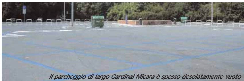
Il parcheggio di largo Cardinal Micara è spesso desolatamente vuoto