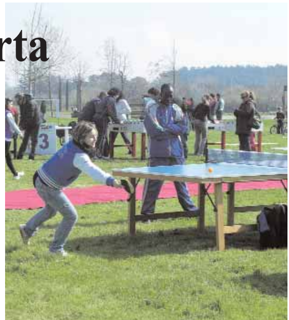
Il tennis da tavolo è stato molto apprezzato dai ragazzi