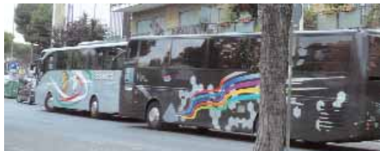
Su via Gregorio VII si formano file di torpedoni in sosta

Con l'arrivo dei turisti in città, i pullman tornano a scorrazzare ovunque snobbando le soste a pagamento a loro adibite