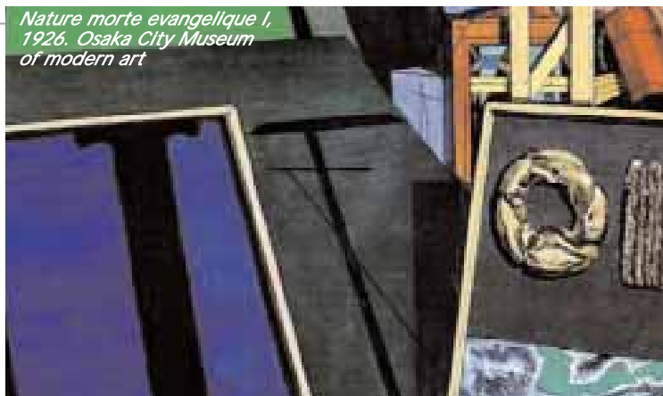
Nature morte evangelique I, 1926. Osaka City Museum of modern art

metafisici degli ultimi anni - de al pittore una possibile soluzione all'enigma del suo apparire". spiegano gli organizzatori - la mostra offre un'occasione originale di avvicinarsi alla sua arte, ponendo l'accento su un tema specifico: lo sguardo del pittore sul mondo della natura. In De Chirico, infatti, l'idea di natura rimane un riferimento costante, sia quando viene idealizzata come nei paesaggi mitologici o esaltata come apparizione poetica nelle celebri "vite silenziose", sia quando è trasfigurata nell'allucinazione urbana delle piazze d'Italia o rinnegata nelle algide geometrie dei manichini. La natura, intesa come cosmo ordinato o come caos, è di per sé indistricabile e chie-