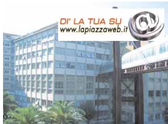
Il policlinico Gemelli si arricchisce di un servizio in più

L'augurio, infatti, è che anche questo nuovo servizio istituito al Gemelli, non operi nell'ombra per le donne che non hanno la possibilità di conoscere, grazie ad internet, la tv e la stampa, la sua esisten-