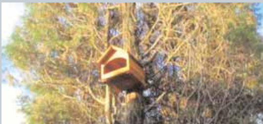
Una bat-box, la cassetta che attira i pipistrelli

Il 13 marzo scorso, presso il centro anziani di Tiburtino III, nel territorio del V municipio, si è tenuta la quarta iniziativa dal titolo "Il territorio che abbiamo in mente", dedicata alla valorizzazione degli spazi comuni e degli spazi verdi, organizzata dall'Ater del Comune di Roma e dal Cns, l'azienda appaltatrice dei servizi di pulizia e igiene ambientale, con la collaborazione del V municipio.