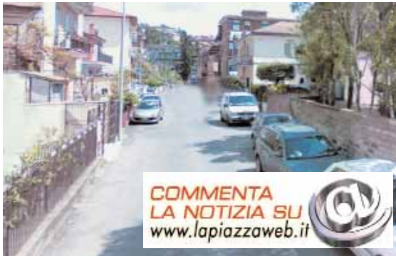
Via Veientana Vetere, una strada lunga e stretta

I cittadini sono dunque sul piede di guerra perché di fatto l'introduzione del senso unico nella via Veientana Vetere aveva portato evidenti benefici: meno incidenti, assenza di ingorghi e anche una riduzione dello smog. Con i cittadini si è schierato il presidente uscente della commissione Lavori pubblici della Regione Lazio, Giovanni Carapella, che ha definito “singolare” la sentenza del Consiglio di Stato “perché ha accolto la richiesta di un