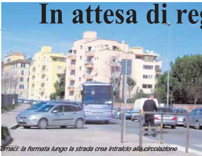
Via Nuova delle Fornaci: la fermata lungo la strada crea intralcio alla circolazione