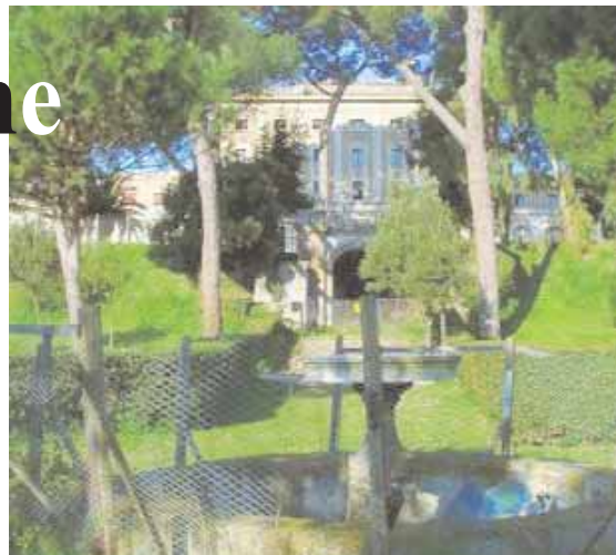
Villa Carpegna sarà il primo sito ad essere riqualificato

Per quanto riguarda gli altri sei siti da riqualificare, ecco l'ammontare del finan-