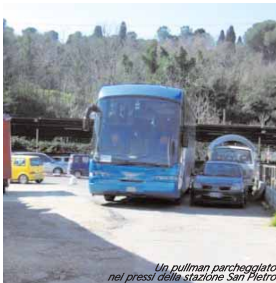
Un pullman parcheggiato nei pressi della stazione San Pietro