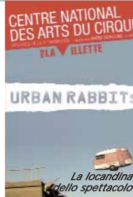
La locandina dello spettacolo

Non è un caso singolare che Schilling - "una figura emblematica del rinnovamento teatrale nei paesi dell'ex blocco sovietico" come si legge nelle motivazio-