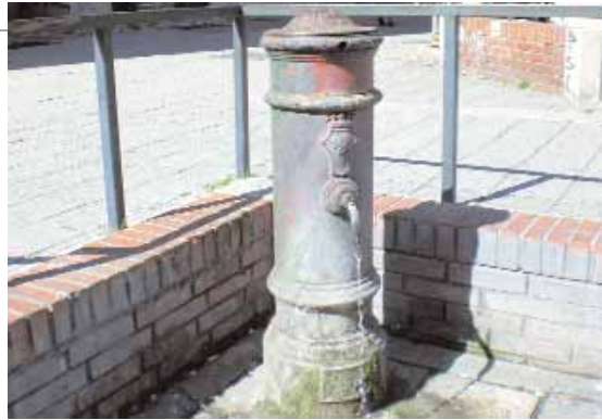
Il "nasone", uno dei simboli della città di Roma