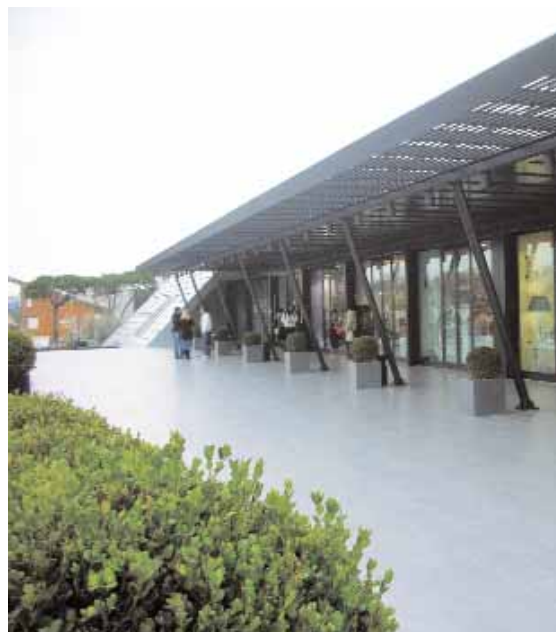
L'edificio dell'Olgiate shopping Plaza

Oltre ad essere costruito da un privato su terreno pubblico l'Olgiate shopping Plaza è un centro innovativo perché costruito con grande attenzione per l'ambiente. Rispetto agli altri centri commerciali nel Plaza i negozi sono collegati direttamente agli spazi verdi. Non è dunque un edificio che ospita al suo interno attività commerciali, ma gli esercizi sorgono intorno a giardini, fontane, spazi esterni attrezzati. Gli edifici, in altre parole, sono pensati per inserirsi nelle aree naturalistiche in modo non invadente nel più completo rispetto degli spazi verdi. Il rispetto e la tutela dell'ambiente inoltre si estende ai materiali a basso impatto ambientale usati per la costruzione, ed anche al risparmio energe-