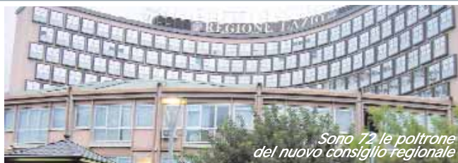
Sono 72 le poltrone del nuovo consiglio regionale