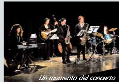
Un momento del concerto

Uno spettacolo di musica jazz tutto al femminile. Questa l'ultima iniziativa dell'associazione Eva (Espansione e valorizzazione delle attività femminili) per la promozione della cultura di genere.