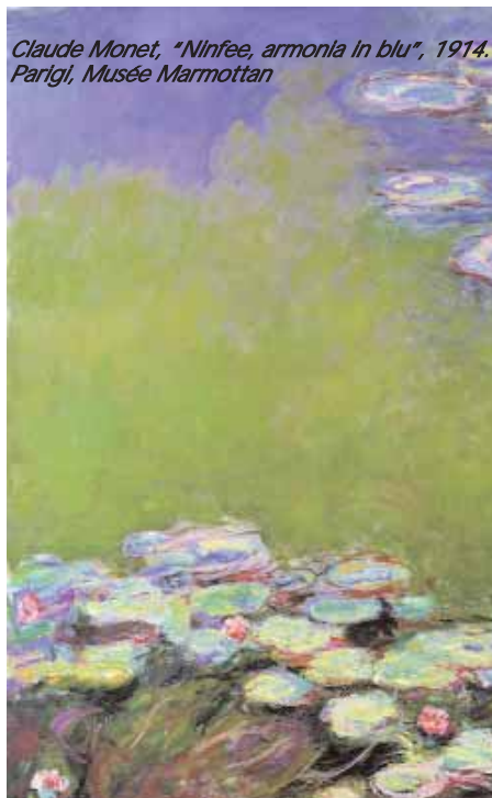
Claude Monet, "Ninfee, armonia in blu", 1914. Parigi, Musée Marmottan

Fino al 29 giugno al Complesso del Vittoriano, via di San Pietro in Carcere. Lunedì-giovedì 9.30 - 19.30; venerdì e sabato 9.30 - 23.30; domenica 9.30 - 20.30