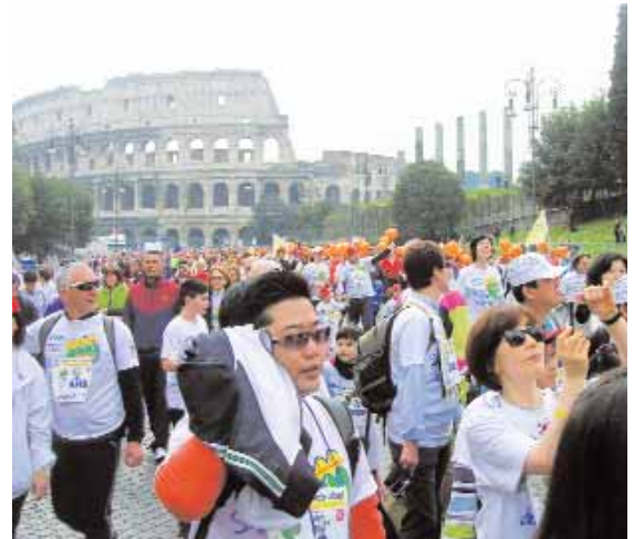
Il popolo della stracittadina romana sotto il Colosseo; in basso, due protagonisti della manifestazione sportiva

È proprio vero: in un giorno così non serve arrivare al traguardo per essere considerati degli eroi.