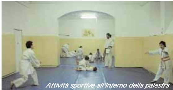
Attività sportive all'interno della palestra